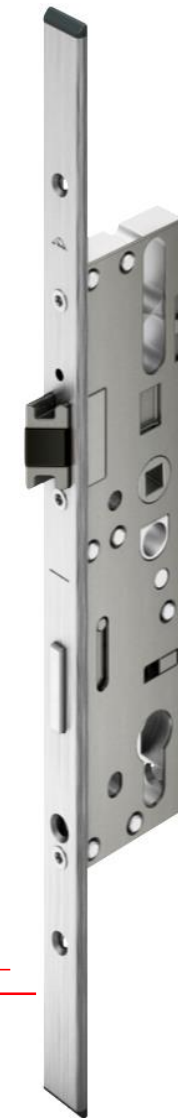
Основной замок H650 AL