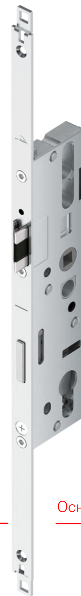
Основной замок H650 трёхсоставной