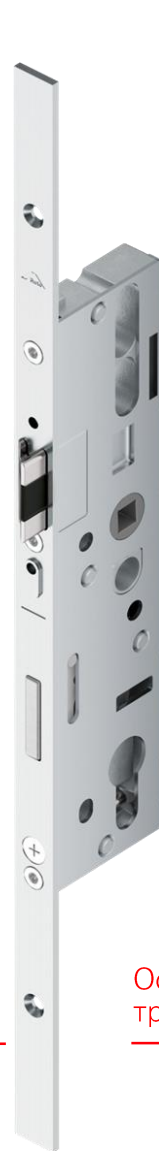
Основной замок H650