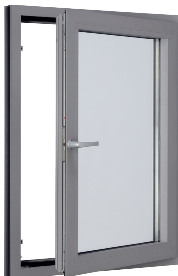
Алюминиевое окно с фурнитурой Roto AluVision Designo и скрытыми петлями

Roto AluVision Designo базируется на системе фурнитуры Roto AL, благодаря чему сокращаются складские запасы, что ведет к снижению затрат. Нижняя петля на раме сконструированна так, что нет необходимости в дополнительной обработке профиля. Все элементы петли как на раме, так и на створке крепятся на клеммах, что облегчает монтаж и сокращает временные ресурсы. Кроме того, последующая регулировка петель максимально удобна: фурнитуру Roto AluVision Designo можно смонтировать и отрегулировать при помощи всего 2 ключей. Преимущества для потребителей: интегрированные в петли смазочные приспособления обеспечивают постоянную и продолжительную по времени смазку, что снижает износ, повышает долговечность и значительно уменьшает работы по техническому обслуживанию.