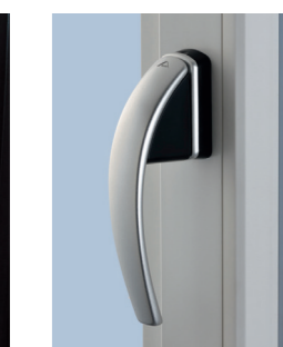
Ручка Roto Swing с врезным основным запором