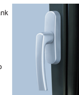
Roto Line, накладная ручка

Кроме врезного основного запора и надежной накладной ручки, Roto Frank обладает широким выбором ручек любой формы и на любой вкус, например, ручка без розетки или инновационная ручка Roto Swing, которая придает окну неповторимую индивидуальность.