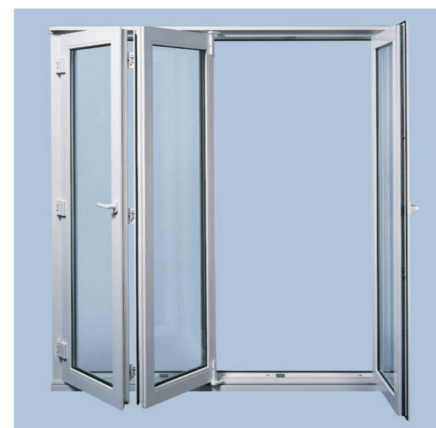
Alu Vision Patio Fold с установленной поворотно-откидной створкой.

AluVision Alversa идеально подходит для окон и дверей, которые должны открываться полностью и при этом не занимать много места, особенно в школах, больницах, офисах, а также при проектировании террас и зимних садов. Благодаря плотному запираению эта система обладает первоклассной звуко- и теплоизоляцией. Большим преимуществом является использование стандартных профилей для створок и рам. Сдвижной механизм обладает легким ходом и изнашивается незначительно. Система Roto Patio Alversa может быть оснащена противозломными элементами. Возможно изготовление наклонно-раздвижных систем шириной от 630 до 1680 мм и высотой от 930 до 2330 мм. В штапеловом исполнении ширина прохода может достигать 3300 мм.