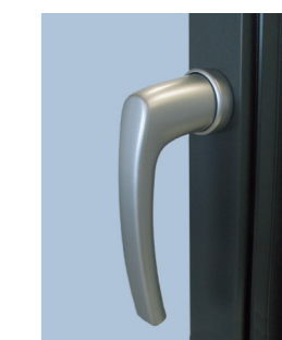
Врезной основной запор с ручкой без розетки